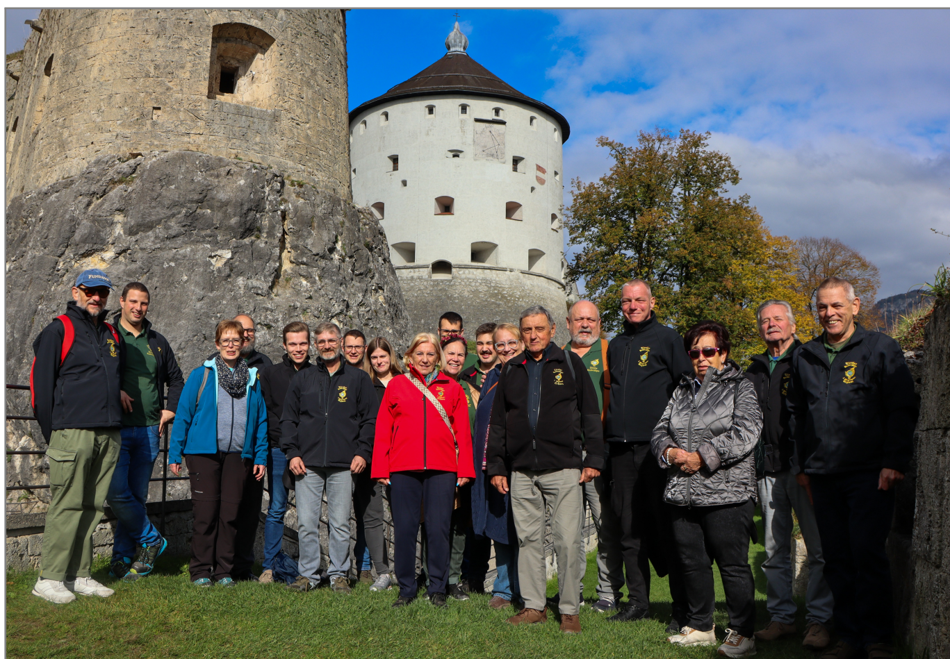
Toller Tag, mit tollen Menschen an einem tollen Ort!