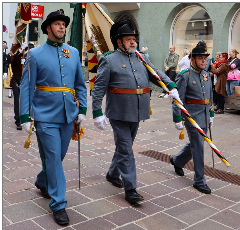
Stets im Gleichschritt

Eine besondere Ausrückung stellte das 125. Stiftungsfest der schwazer Studentenverbindung Fundsberg dar. Der Einblick in ein solches Fest war für unsere Teilnehmer sehr spannend!