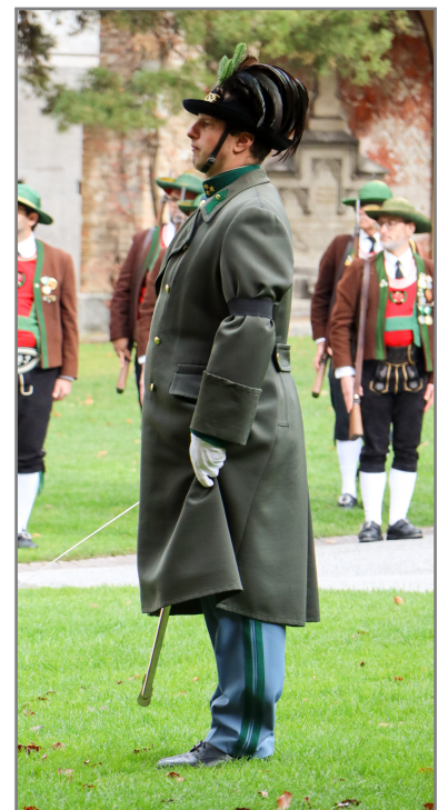
Hauptmann bei der Ehrenbezeugung