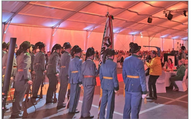
Im Festzelt auf der Bühne!

Als Teil einer Ehrenformation des Tiroler Kaiserjägerbundes reisten fünf Schwazer Kaiserjäger zur 150 Jahrfeier der Firma Nemetz in Niederösterreich. Trotz strömendem Regen wurde eine tolle Ehrensalue von uns abgegeben.