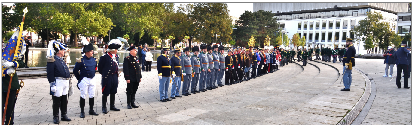
Aufstellung vor der Kirche!