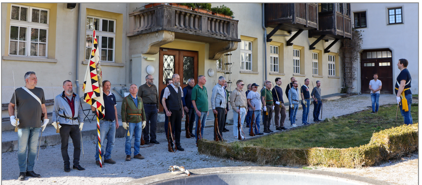
Die angetretene Truppe!

Es handelt sich zwar nicht um eine normale Ausrückung, trotzdem aber ist der 1. Kommandokurs des Kaiserjägerbundes, der von unserem Hauptmann geplant und durchgeführt wurde, einer der Höhepunkte dieses Jahres! An diesem Tag versammelten sich in unserem Vereinsheim die Offiziere des Kaiserjägerbundes, um sowohl Kommandos, aber auch die richtige Verwendung des Säbels zu erlernen und zu üben.