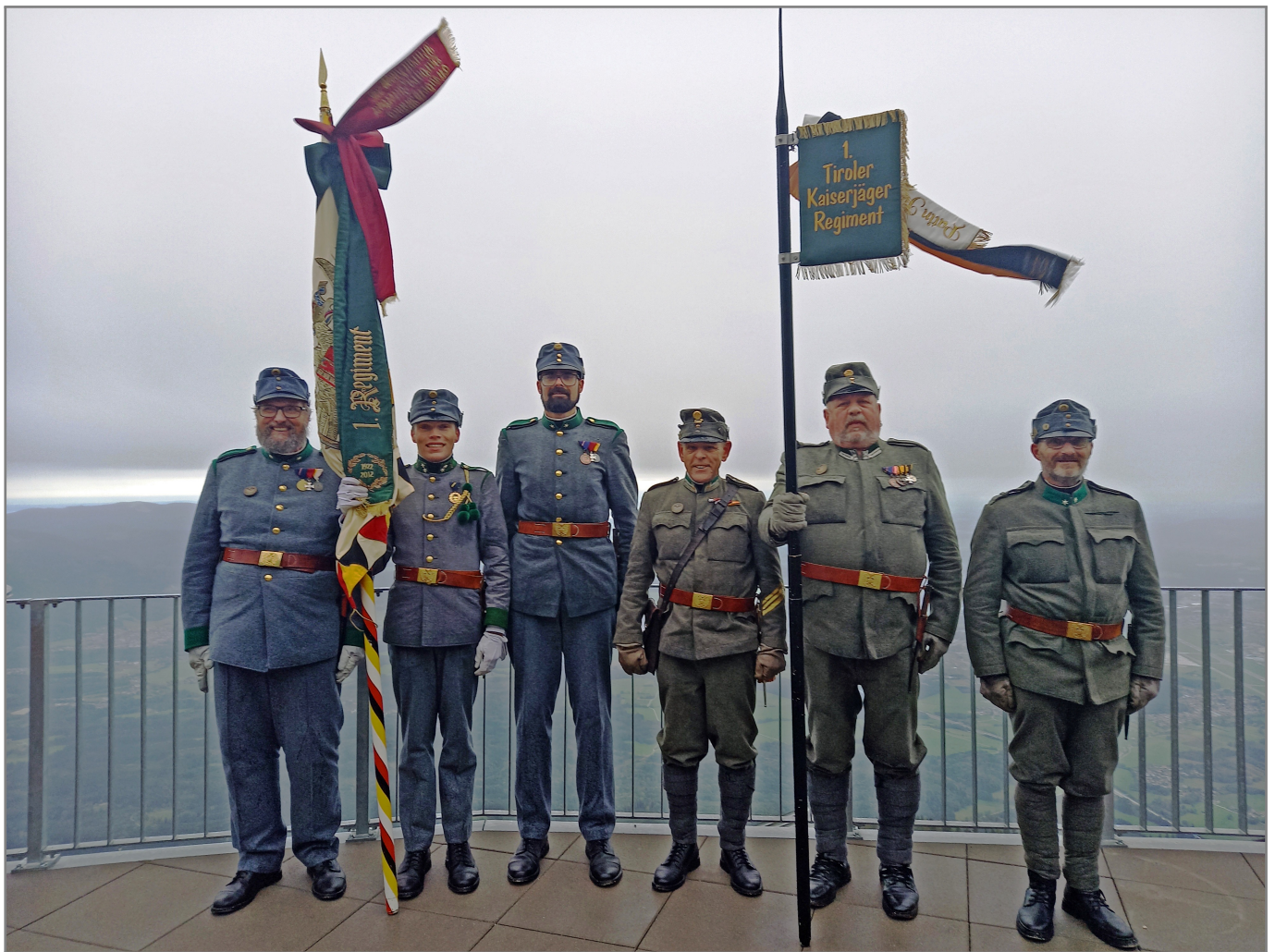
Eine sehr durchnässte Mannschaft!