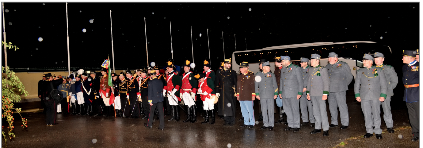
Kaiserjäger... wie immer ein Blickfang!

Am Abend trafen wir uns erneut beim HSV Wien um gemeinsam Abend zu essen und einer Darbietung des großen deutschen Zapfenstreichs, durchgeführt durch den Spielmannszug der Bürgerwache Bad Saulgau, beizuwohnen.