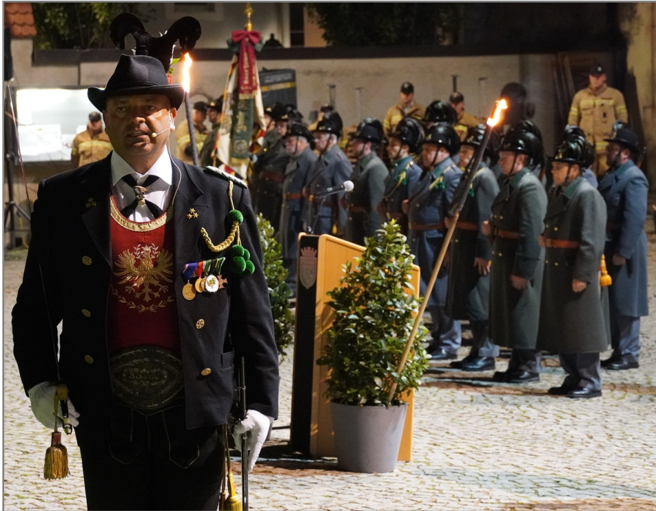
Der Gesamtkommandant und die Kaiserjäger...

Traditionell findet am Ende der Kulturmeile der Große Österreichische Zapfenstreich im Stadtpark statt. Dort vertreten wir Schwazer Kaiserjäger als Ehrenformation das Österreichische Bundesheer. Dieses Mal wurden wir auch von den Kameraden aus Rum verstärkt! Wie jedes Jahr zieht dieses Ereignis viele hunderte Zuschauer an.