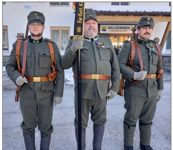
Bereit für die Musterung...

Am 07. März feierte das Österreichische Bundesheer sein 70-jähriges Bestehen. Zu diesem Anlass rückten wir in der Wattener Lizum in unserer Felduniform aus. Zu dieser Zeit leistete unser Waffenwart seinen Grundwehrdienst, konnte aber dennoch bei uns ausrücken.