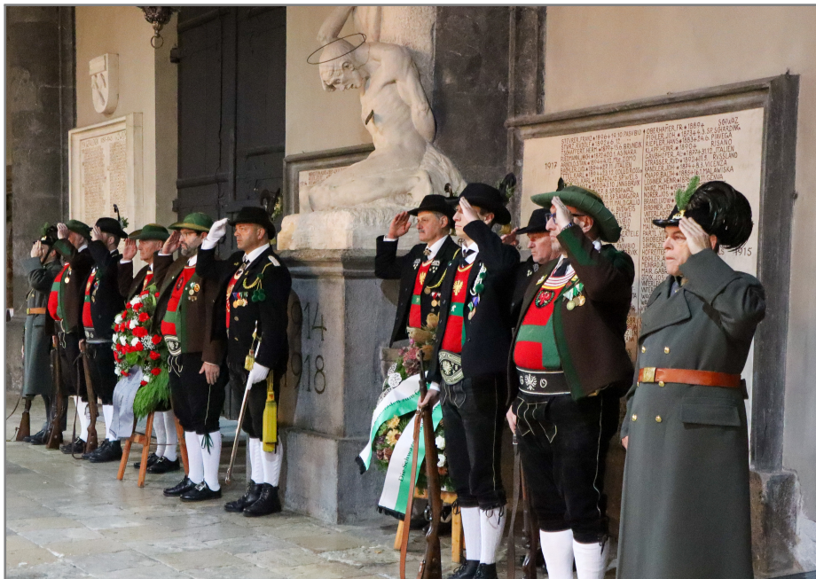
Kranzniederlegung für die Gefallenen...