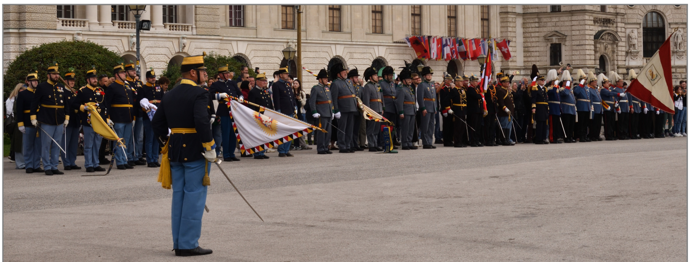
Das Ganze... rechts schaut!

Den Abschluss des Generalrapports bildete das Gemeinsame Abendessen im Restaurant Stöckl im Park. Am nächsten Tag machten wir Kaiserjäger uns auf in die Heimat, wobei die Vorfreude auf den nächsten Rapport bereits jetzt riesengroß ist!