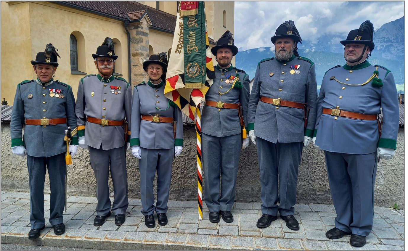
Eine stolze Mannschaft!

Auch schon fast zur Tradition wurde, dass wir von unseren Kameraden vom 2. Regiment Südtirol bei der Herz-Jesu Prozession am Weerberg unterstützt werden.