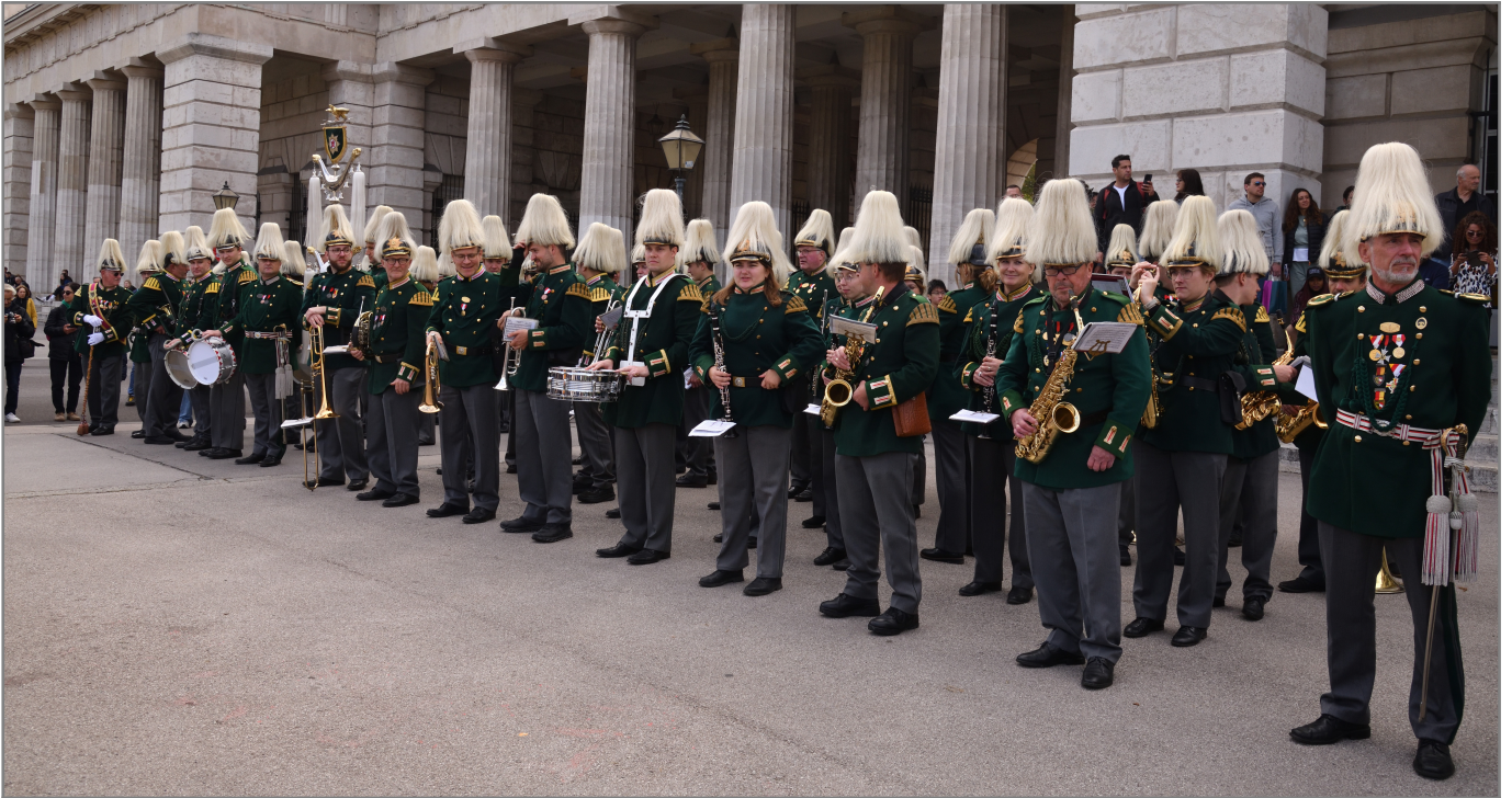
Spielmannszug der Bürgergarde Saulgau

Trotz all dieser tollen Erlebnisse war der absolute Höhepunkt der Festakt in der unmittelbaren Nähe der Hofburg und des Heldenplatzes! Zuerst versammelten wir uns alle am Heldentor. Nach der Aufstellung marschierten wir im Takt des Spielmannszugs auf den Platz.