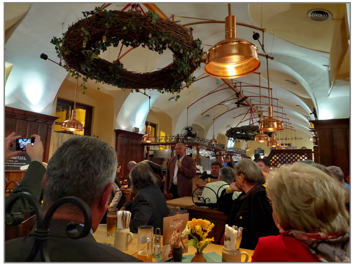
Ansprache durch den Präsidenten

Bereits am Donnerstag reisten sieben Kaiserjäger in die Bundeshauptstadt, um am Meet & Greet im Salmbräu teilzunehmen.