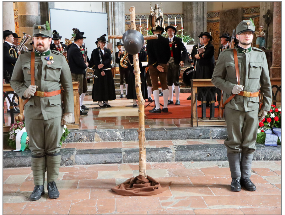
Jäger in Felduniform als Wache...

Obwohl wir Kaiserjäger jedes Jahr viele Ausrückungen bestreiten, hat für uns der Totensonntag eine besondere Bedeutung. An diesem Tag wird an alle Opfer von Krieg, Terror und Gewalt gedacht. Als militärischer Traditionsverein ist es daher unsere Aufgabe für Frieden und Kameradschaft einzutreten!