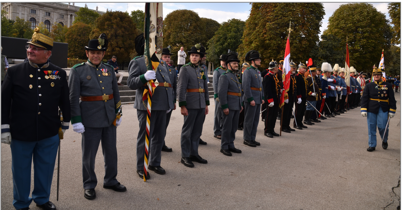
Aufstellung am Heldentor!