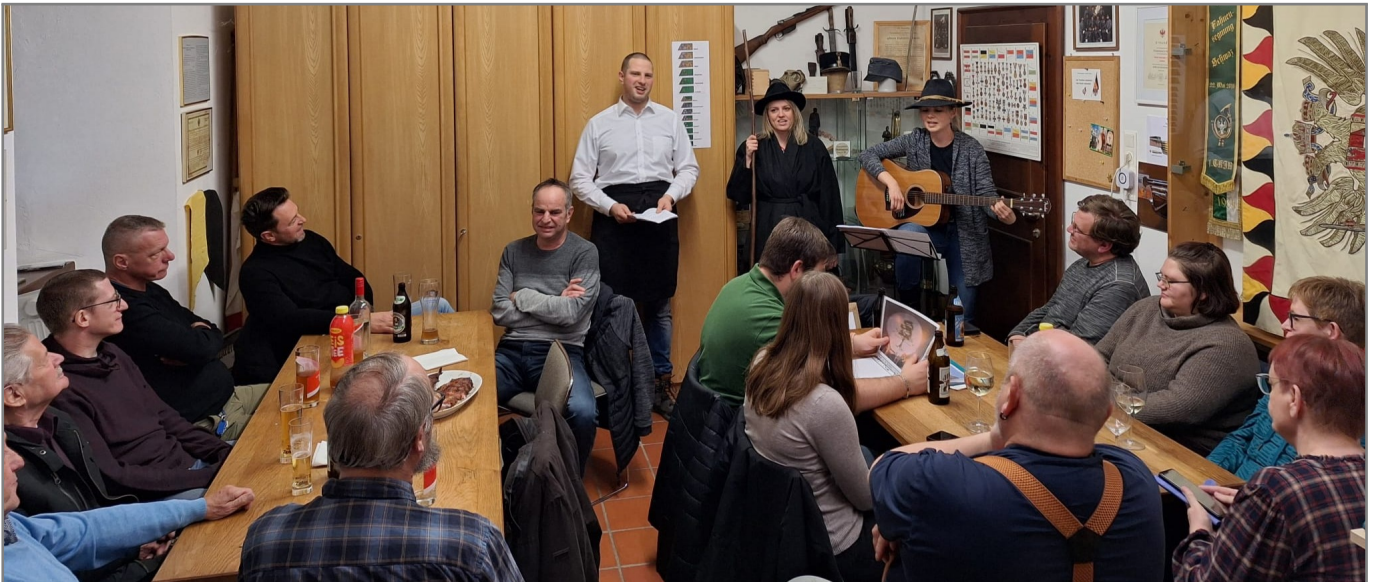
Ohrenschmaus im Vereinsheim

Anklöpfler im Vereinsheim! Natürlich waren auch dieses Jahr wieder alle eingeladen, die zwar nicht aktives Mitglied sind, aber den Verein immer wieder tatkräftig unterstützen.