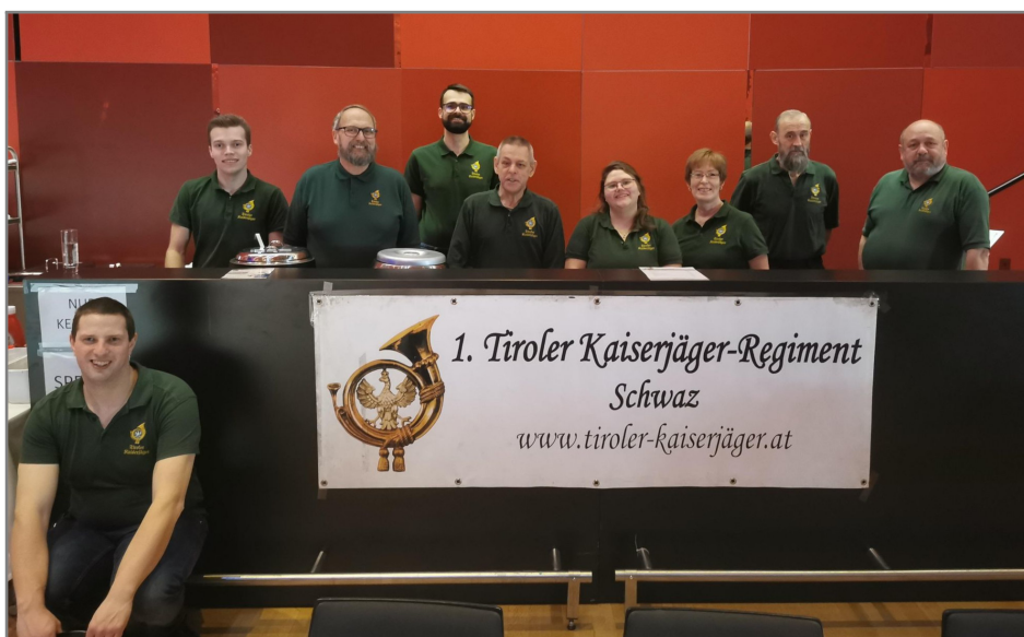
Anpacken gehört auch zu des Jägers' Aufgaben.

Auch dieses Jahr durften wir Schwazer Kaiserjäger wieder die Verpflegung der Gäste beim Rosenmontagsball des Seniorenreferates übernehmen, der dieses Jahr am 03. März stattfand. Obwohl es bereits das 3. Mal ist, sind wir jedes Jahr über die große Anzahl an Gästen überrascht. Natürlich bedeutet dies jede Menge Arbeit, die wir aber natürlich trotzdem mit Freude machen, da es für den Verein eine wichtige Stütze ist.