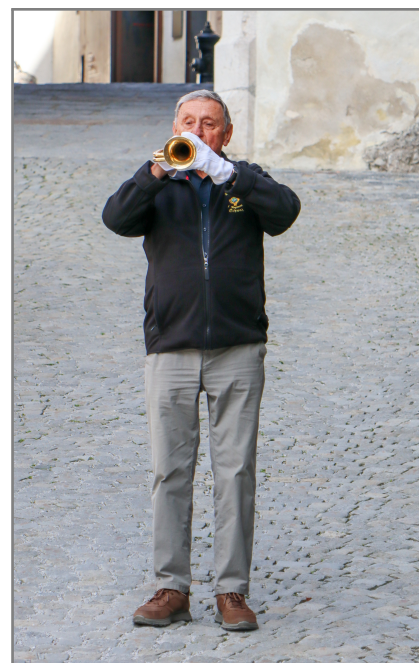
Das Horn ist immer am Mann!

Alle zwei Jahre planen wir einen Vereinsausflug, der sowohl lehrreich, aber natürlich auch kameradschaftlich sein sollte. Dieses Jahr führte es uns daher zur Festung Kufstein. Dort wurden wir von einer tollen Führerin durch die Festung begleitet. Ein Höhepunkt war natürlich die Ausstellung über die Kaiserjäger in der Heldenorgel. Nachher lud der Verein zu einem gemeinsamen Essen im Gasthaus Purlepaus in Kufstein ein.