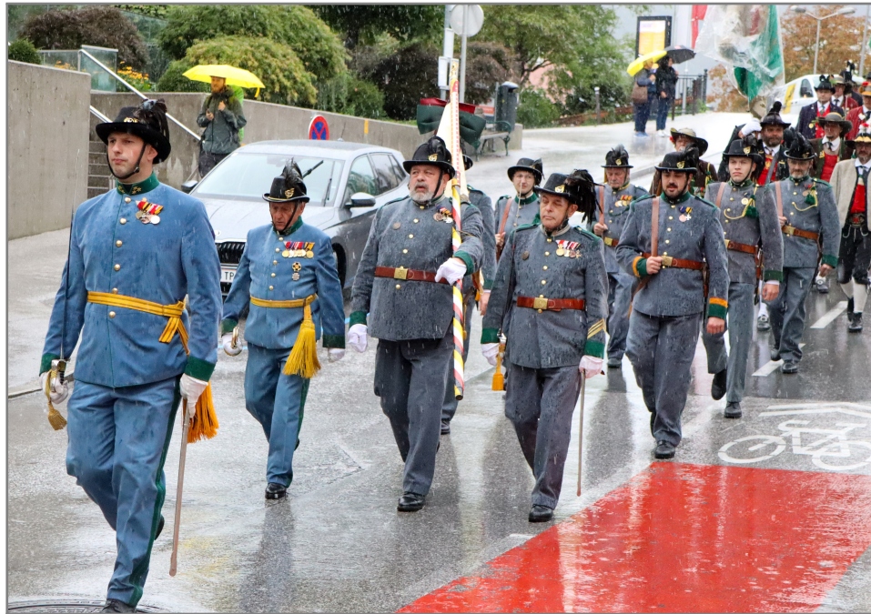
Aufmarsch bei heftigem Regen!

Nach zweijähriger Bauzeit fand die Einweihung der neuen Steinbrücke in Schwaz statt. Neben den Vereinen aus der Stadt und dem Bezirk Schwaz nahmen auch wir Kaiserjäger an dieser besonderen Feierlichkeit als Ehrenzug teil und schossen zur Eröffnung eine Salve!