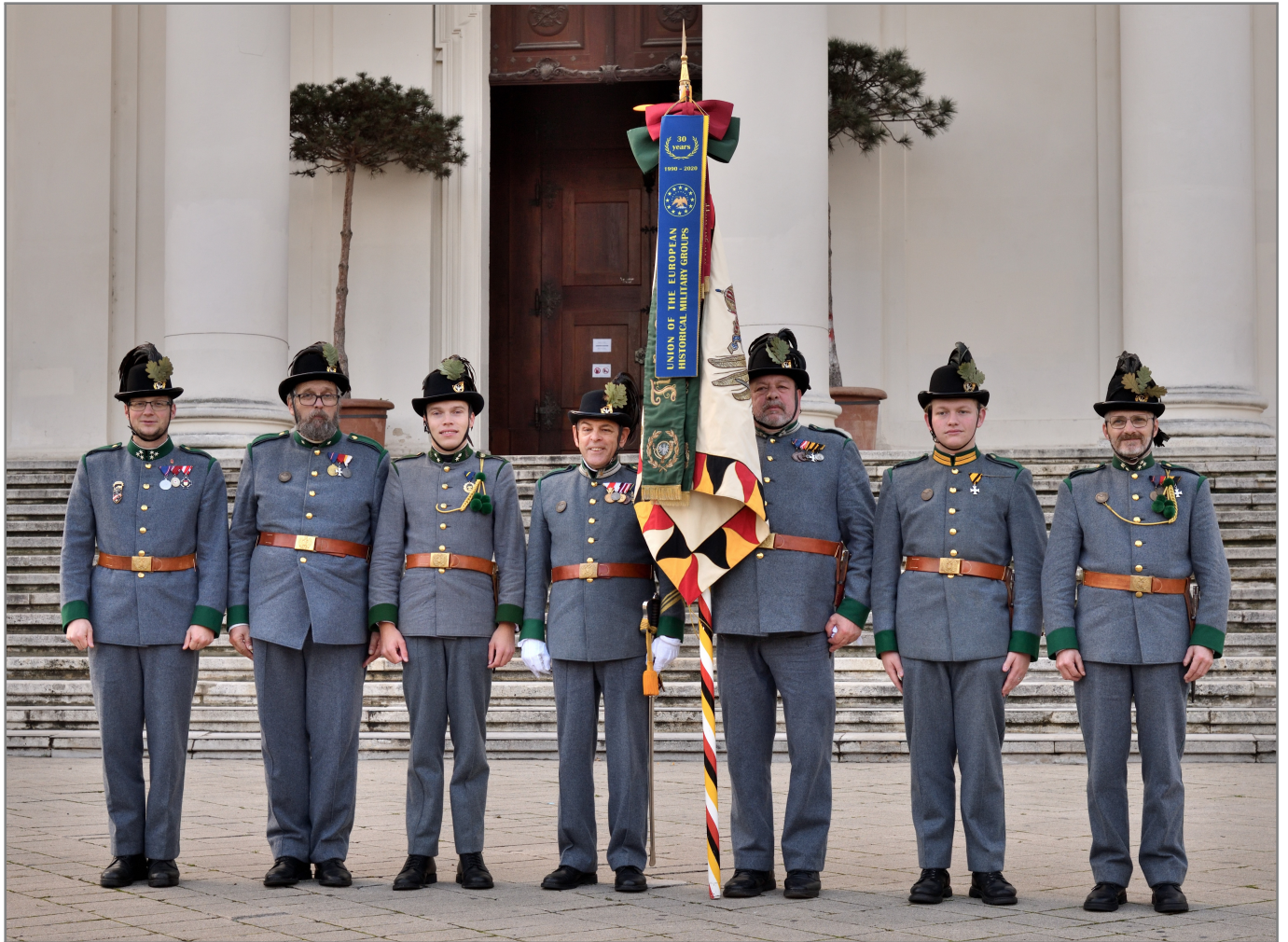
Unsere Abordnung vor der Karlskirche!

Am Samstag versammelten wir uns am Karlsplatz. Nachdem wir uns formiert haben, marschierten wir in die Karlskirche, um dort an einer Messe teilzunehmen. Auch diese wurde musikalisch vom Spielmannszug der Bürgergarde Saulgau untermalt. Am Ende wurde noch an alle Opfer von Krieg, Terror und Gewalt gedacht.