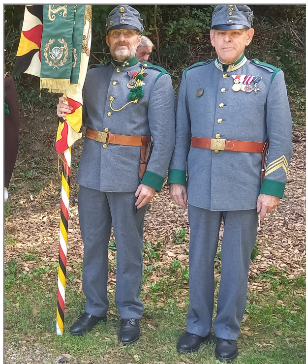
Herr 'Major' und Herr Obmann

Diese Prozession ist die letzte der zahlreichen Prozessionen die in Schwaz stattfinden. Obwohl sie nur relativ kurz ist, besitzt sie einen besonderen Charme. Wie jedes Jahr waren natürlich wir Schwazer Kaiserjäger wieder mit dabei.