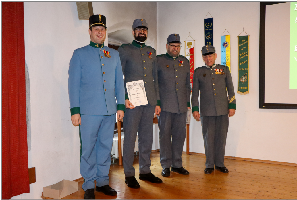
Obmann und Hauptmann mit den glücklichen Beförderten.